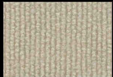
0036 Light Beige