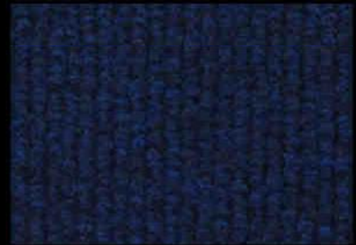
0024 Dark Blue