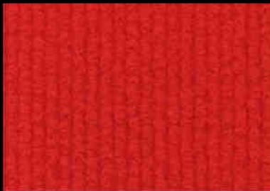
0052 Bright Red