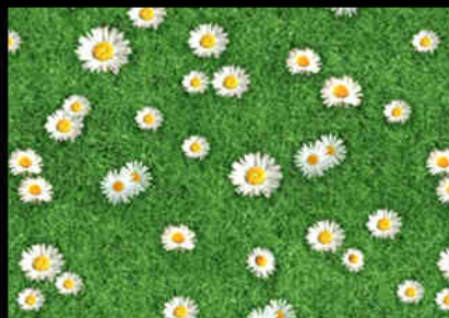
FLOWERLOOK Flowered Grass