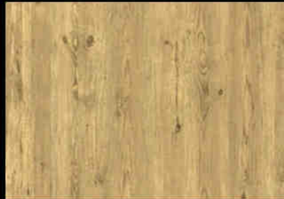
WOODENLOOK Wooden Floor